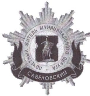
Рисунок нагрудного знака к званию «Почетный житель внутригородского муниципального образования – муниципального округа Савеловский в городе Москве»

Приложение 3 к решению Совета депутатов внутригородского муниципального образования – муниципального округа Савеловский в городе Москве от 19 февраля 2025 года № 2/1