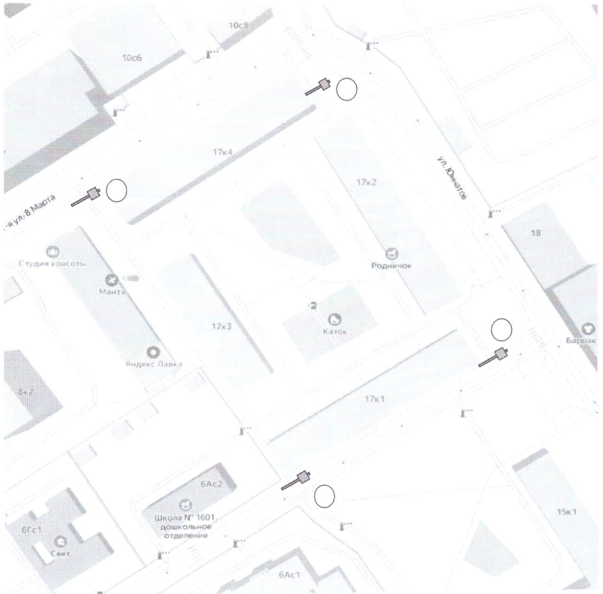
Схема установки ограждающих устройств (4 шлагбаума) на придомовой территории в муниципальном округе Савеловский в городе Москве по адресам: г. Москва, ул. Юннатов дом 17, корп. 1, корп. 2; корп. 3, корп. 4.