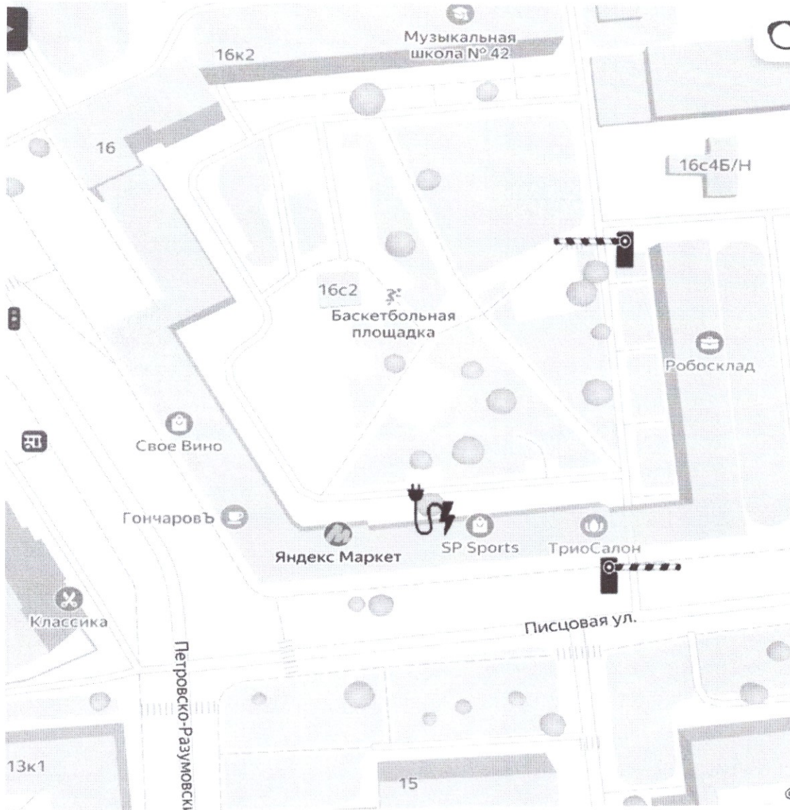
Схема установки ограждающих устройств (2 шлагбаума) на придомовой территории в муниципальном округе Савеловский в городе Москве по адресу: г. Москва, Петровско-Разумовский проезд, дом 16