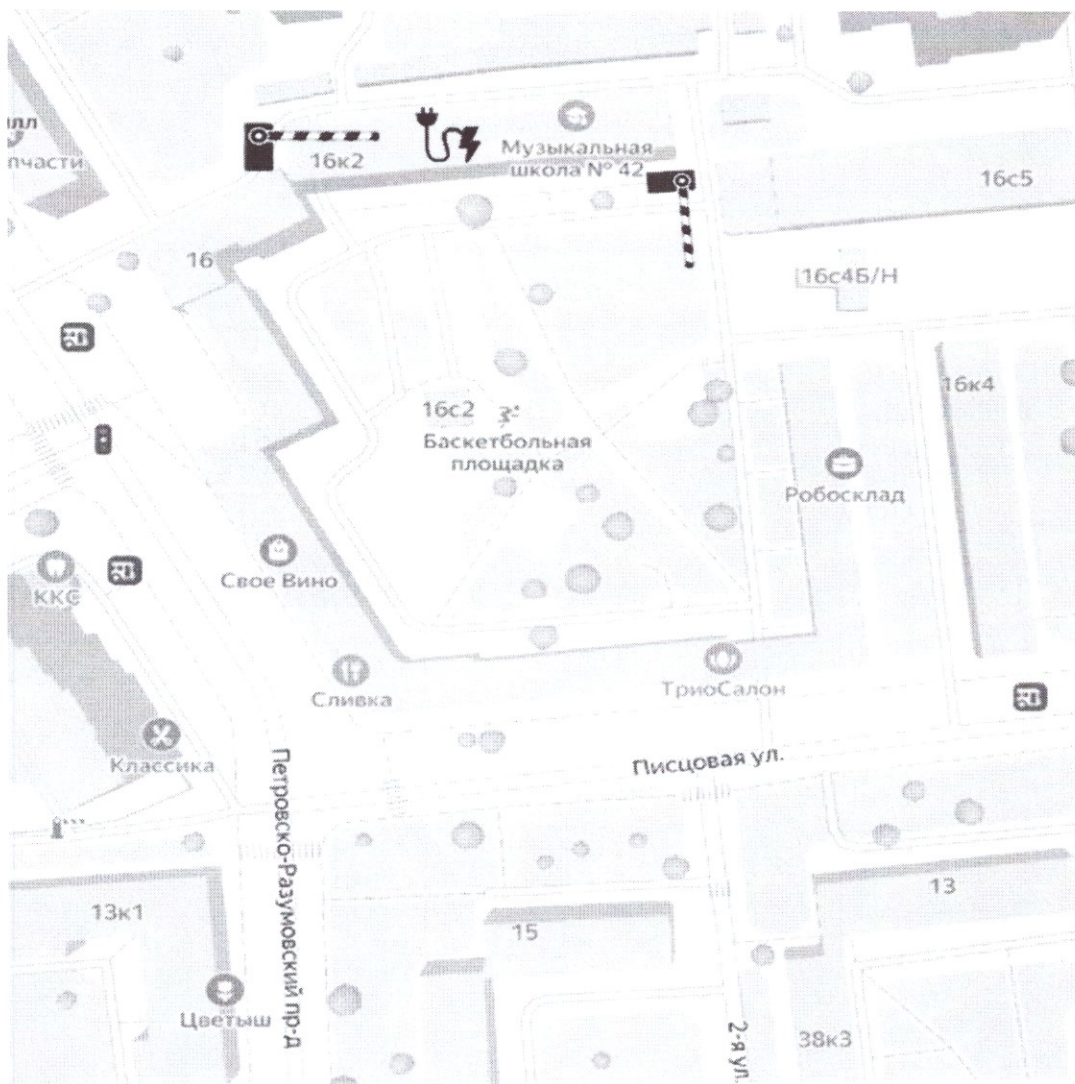
Схема установки ограждающих устройств (2 шлагбаума) на придомовой территории в муниципальном округе Савеловский в городе Москве по адресу: г. Москва, Петровско-Разумовский проезд, дом 16, корпус 2